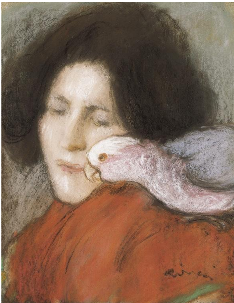
Rippl-Rónai József : Lazarine papagájjal

Sajnos - ahogy történetük folytatódik-, fény derül rá, hogy az asszony mégis rosszul tette, hogy vakon bízott kedvesében, ugyanis egy új múzsa feltűnése nemsokára borút hozott a családi idillre.