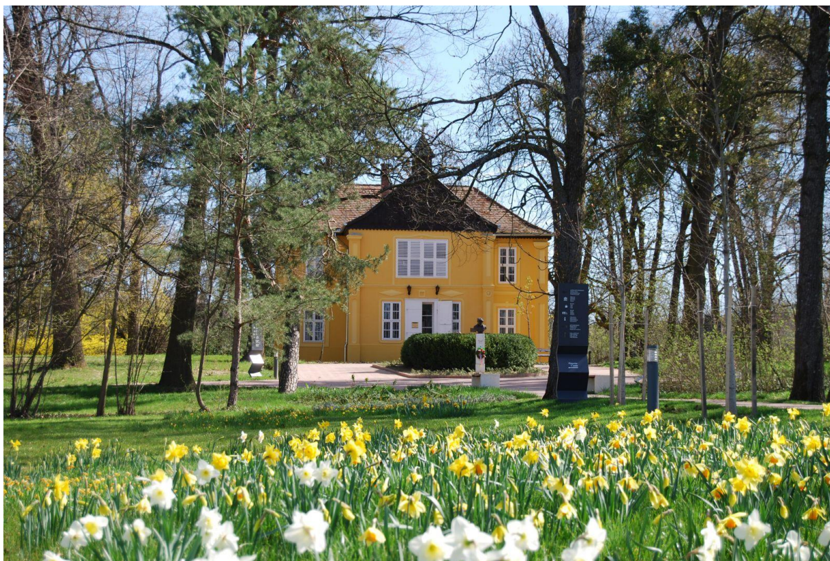
A Rippl-Rónai Emlékház 2015-ben

Dolgozatom írása közben magam is sokat tanultam, új információkhoz jutottam és remélem, hogy az, aki elolvassa, hatására szintén szívesen elmélkedik a témáról, vagy legalább is megőriz belőle valamit.