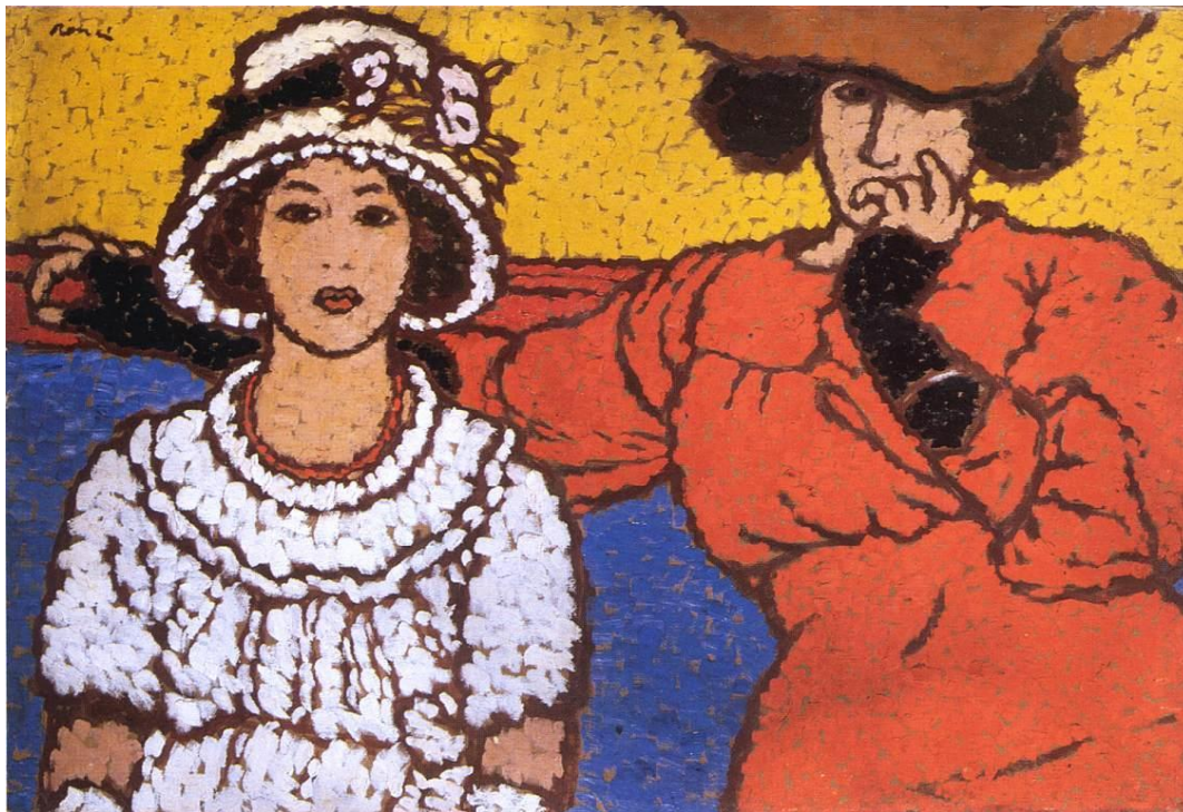
Rippl-Rónai József: Lazarine és Anella (olaj, karton)

olvasni, és dolgozatom megírásában is nagyon sokat segített. Ezen könyvben megtalálható nőalakok közül emelek ki még néhányat, akik a témához kapcsolódnak.